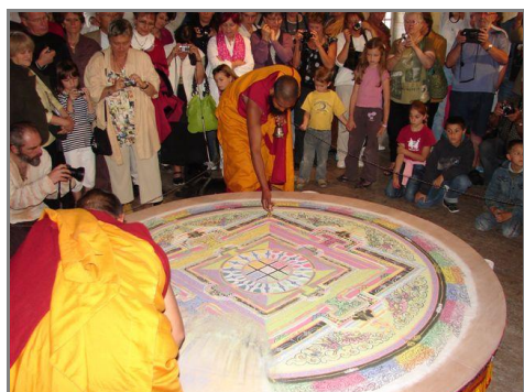
Réalisation du mandala de Vairocana par les moines du Spiti, devant un public conquis