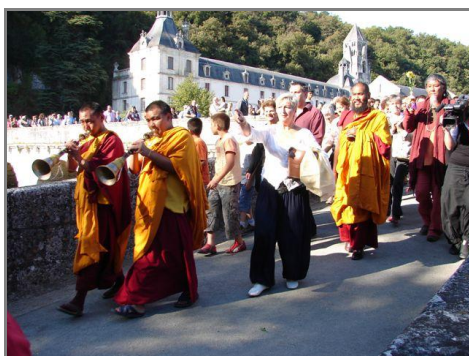
Devant la magnifique abbaye de Brantôme, défilé rituel des moines après la dispersion des sables