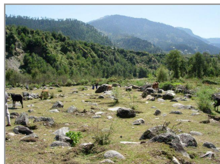
Le terrain que nous attendons avec impatience, au lieu-dit « Pandra Mile » à mi-chemin entre Kullu et Manali.